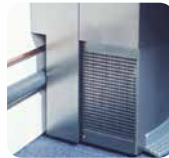
Découpe au dos de la fontaine pour le passage des tuyaux Cutting down to run tubings