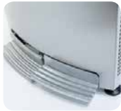
Distribution de l'eau à pédales Water distribution by pedals

A successful design that hides the water inlets pipings and provides total support against the wall. With its pedals distribution and stainless steel grid, the R2000 seduces by its finishes.