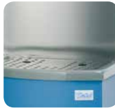
Grille tout inox pour carafes Stainless steel grid for water jugs