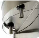
Sorties d'eau amovibles en inox avec protection sanitaire Removable stainless steel water outlets with sanitary protection