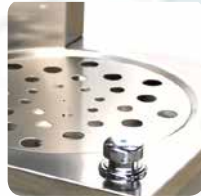
Grille inox pour carafes en option Stainless steel grid for water jugs in option