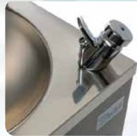
Robinet rince-bouche en option Adjustable height jet tap in option