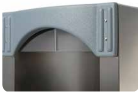
Sortie d'eau inox amovible avec protection sanitaire Removable stainless steel water outlet with sanitary protection

Supplement of elegance and preserved hygiene for the Señorita version, offering a chilled water capacity of 20L or 40L per hour.